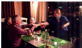
Kulinarischer Kulturaustausch am «Türkischen Abend» in der Siedlung Oerlikon 1.

Einst waren es vor allem Milieus der Arbeiterschaft, die in den ABZ-Siedlungen lebten. Heute ist eine ausgewogene soziale Durchmischung das Ziel.