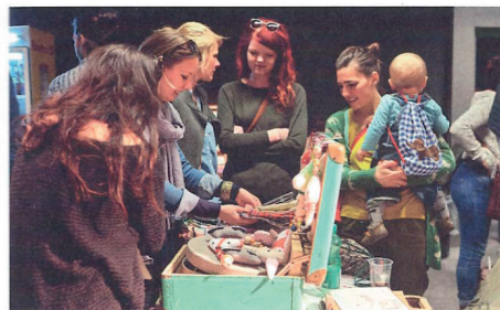
Treffpunkt für Bewohnerinnen und Bewohner aus allen Siedlungen: der ABZ-Koffermarkt.

Die Mitarbeitenden der ABZ-Mieter- und Nachbarschaftshilfe beraten Mieterinnen und Mieter bei finanziellen und persönlichen Schwierigkeiten. Gemeinsam wird nach tragfähigen Lösungen gesucht und wenn nötig, werden externe Fachstellen hinzugezogen. Viel öfter aber geht es darum, bei nachbarschaftlichen Konflikten Strategien vorzuschlagen, wie die Parteien selbst zu einer Einigung kommen.