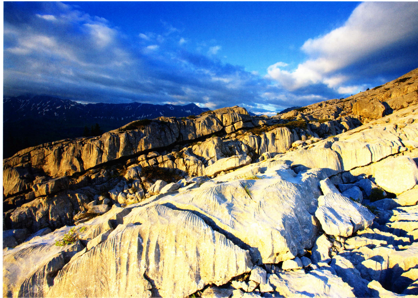
Die Schratzenfluh ist praktisch vegetationslos.

region für Unesco-Biosphärenreservate entwickelt. Nach der Sevilla-Strategie von 1995 werden so die Artenvielfalt geschützt und die ökonomischen Lebensgrundlagen bewahrt. Die Idee der Partizipation hat wesentlich zur Akzeptanz des Modells innerhalb breiter Bevölkerungsschichten beigetragen. In Arbeitsgruppen mit Vertretern aus Landwirtschaft, Handwerk, Handel, Gastronomie und Tourismus werden Nachhaltigkeitsmodelle als fortwährender Prozess «von unten» erarbeitet.