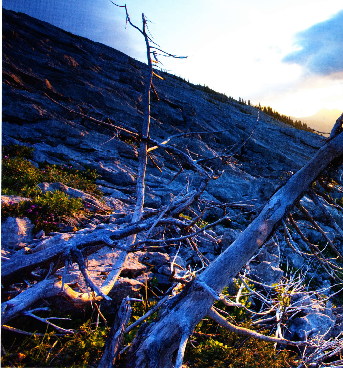
Geheimnisvoll-mystisch: Die Schratzenfluh bei Sonnenaufgang.

einer wasserundurchlässigen Flyschschicht entstanden. Diese Ton- und Sandsteinschichten sind ein Überbleibsel der jüngsten Eiszeit, welche der Landschaft ihr charakteristisches Profil verlieh. Die Gletscher schmirgelten das Gestein ab und hinterliessen im Haupttal langgezogene, sanft einfallende Talflanken sowie die charakteristischen Moränenwälle auf der südlichen Talflanke. Im Kontrast dazu steht das Napfgebiet mit seinen engen Schluchten. Dessen Berge waren während der jüngsten Eiszeit weitgehend eisfrei. So konnten die Flüsse weiterhin ungehindert fließen und formten dabei tiefe Schluchten in das Gebirge.