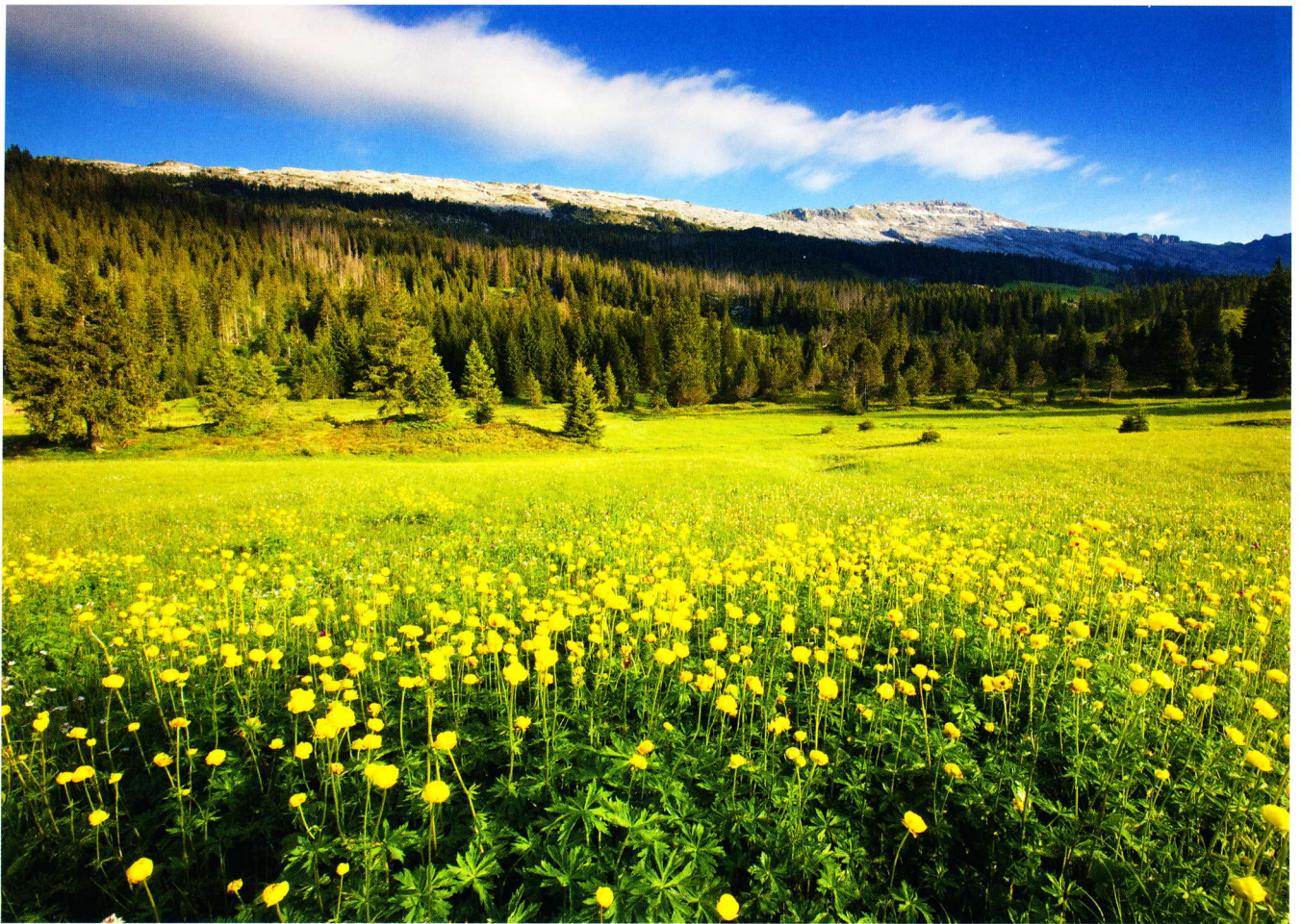
Oben: Wiese mit Trollblumen, im Hintergrund die Schrattenfluh. Rechts: Wollgräser oberhalb von Sörenberg.

Der «Wilde Westen» von Luzern besticht vor allem durch eines: Grün in allen Schattierungen. Saftig grüne Wiesen überziehen die voralpine Hügellandschaft. Ein dichter, dunkelgrüner Mischwald krönt vielerorts die Talhänge. Und dort, wo der Untergrund wasserundurchlässig ist, gedeiht eine weitläufige Moorlandschaft. Das Moor, dem die Bauern einst mühsam durch Entwässerung einen geringen landwirtschaftlichen Ertrag abgerungen haben, diesem Moor verdankt das Entlebuch seit 2002 das Prädikat Unesco-Biosphärenreservat. Damit verbunden sind nachhaltige Zukunftsvisionen für die Region. Die waren von jeher eher dünn gesät. Traditionell lebten die Entlebucher jahrhundertlang von Vieh, Wald und Forstwirtschaft. Ende des 19. Jahrhunderts kam dann ein bescheidener Bädertourismus hinzu. Den eigentlichen touristischen Aufschwung erlebte das Entlebuch erst, als Skifahren seit der Mit-