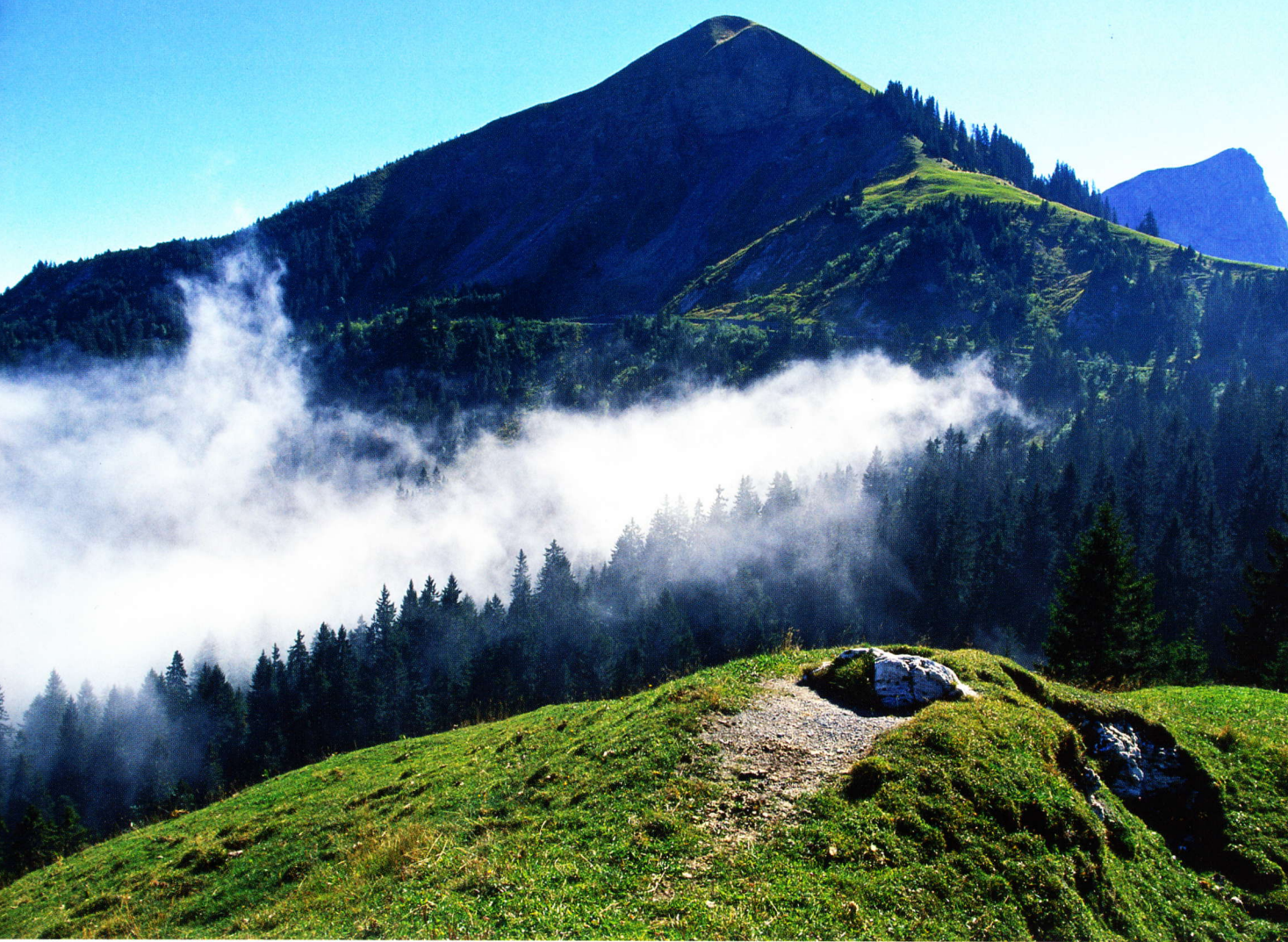
Nebelschwaden am Glaubenbielenpass.