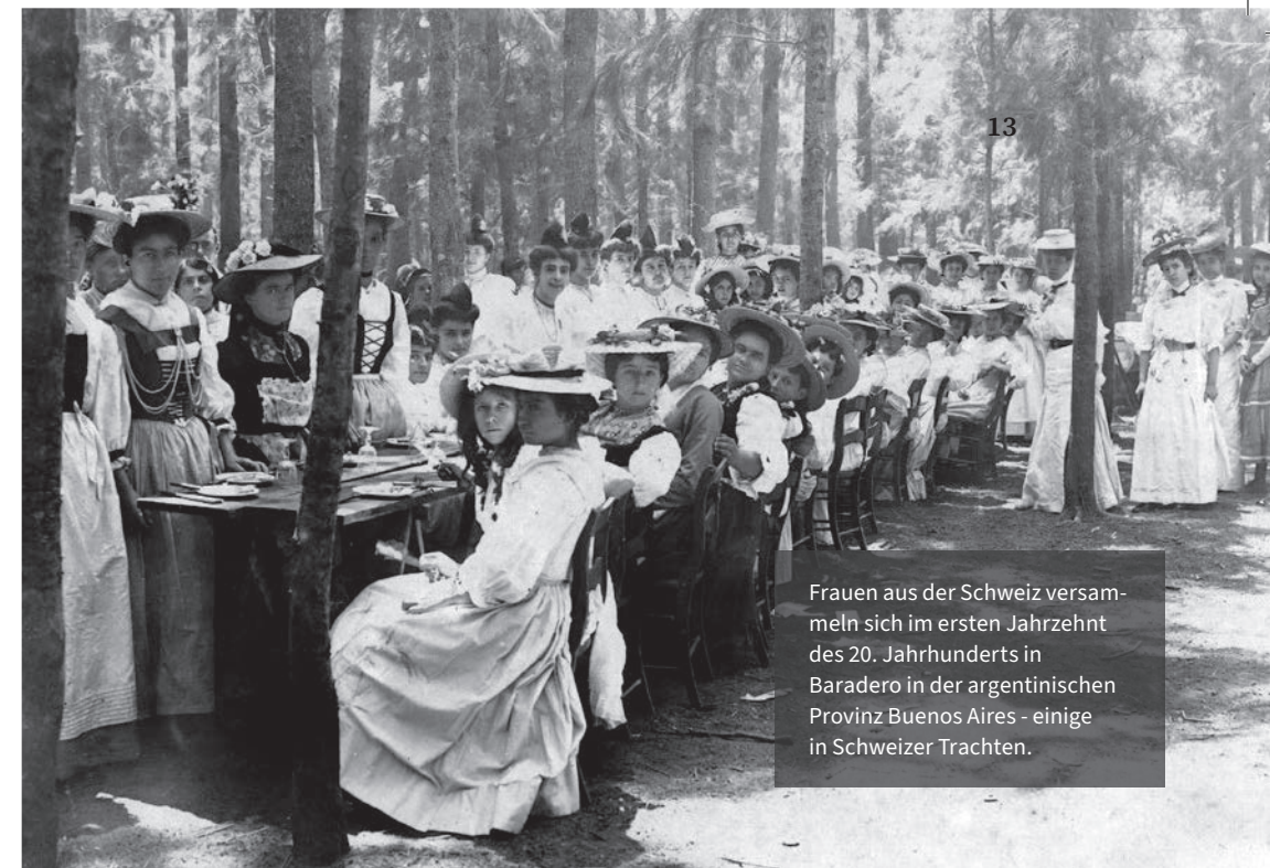
Frauen aus der Schweiz versammeln sich im ersten Jahrzehnt des 20. Jahrhunderts in Baradero in der argentinischen Provinz Buenos Aires - einige in Schweizer Trachten.

1500 Liechtensteinerinnen und Liechtensteiner wanderten in der zweiten Hälfte des 19. Jahrhunderts bis in die 1920er-Jahre vor allem nach Nordamerika aus. Im Thurgau bettelten um 1800 zehn Prozent der Bevölkerung auf der Strasse. Die Abwanderung war gross, allerdings nur im Ausnahmefall nach Übersee. Eine Statistik weist 14 Prozent der Thurgauer Bevölkerung