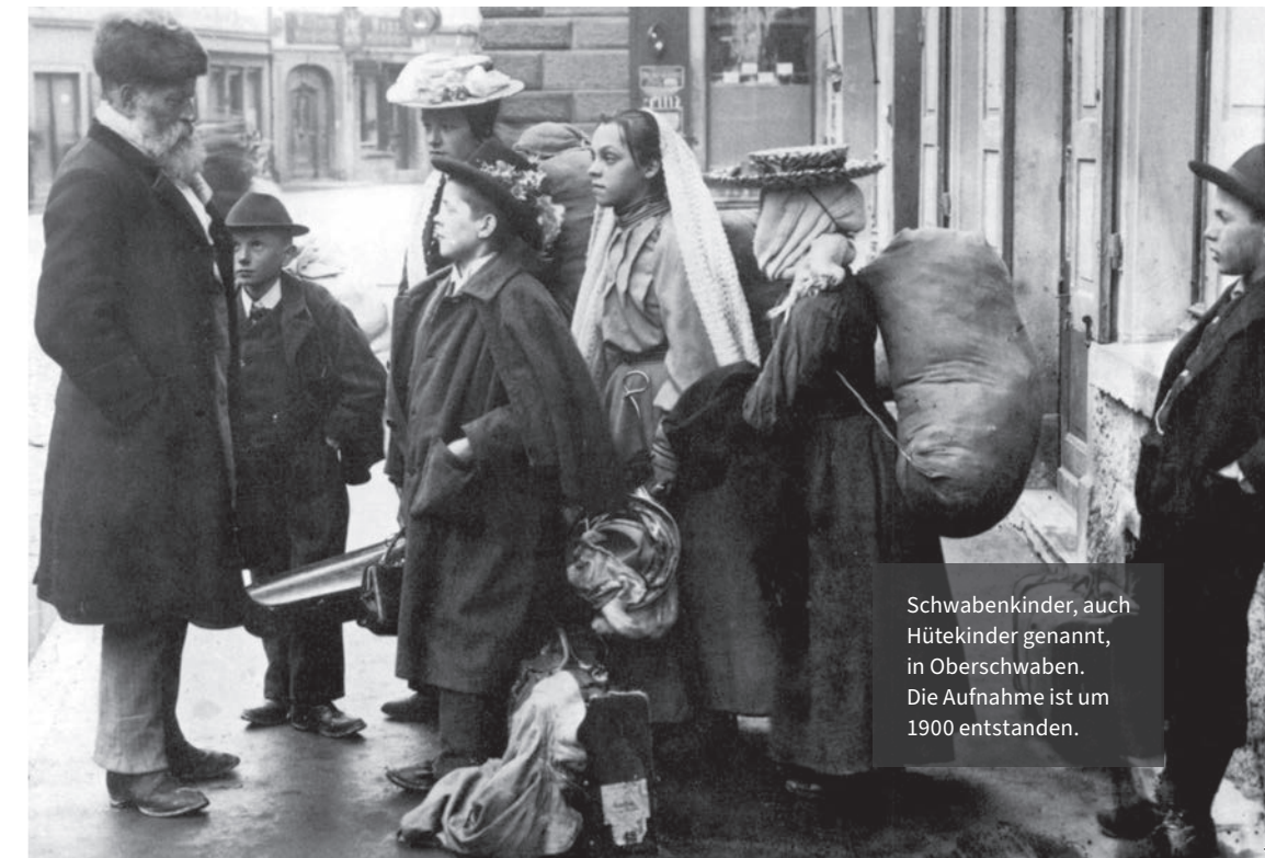
Schwabenkinder, auch Hüttekinder genannt, in Oberschwaben. Die Aufnahme ist um 1900 entstanden.

Der Alpenrhein war vor seiner Korrektion (1861–1890) ein unberechenbares Gewässer, das regelmässig für verheerende Überschwemmungen sorgte.